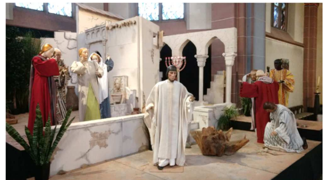
Kapharnaum - ein Fall für den Dachdecker: Freunde lassen die Tragbahre mit dem Gelähmten durch das Dach hinab zu Jesus.