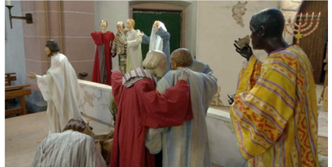
Nazareth - nicht nur Fankurve: Hinten die Fans, vorne die Lästler und Steinewerfer, Jesus geht ungerührt einfach fort