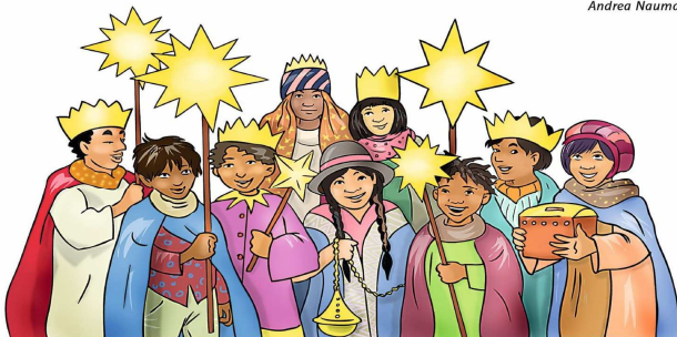
Kinder aus aller Welt für Kinder in der Welt. Leuchtende Sterne des Miteinanders.

Terminkalender , du verfolgst mich und du kennst mich.