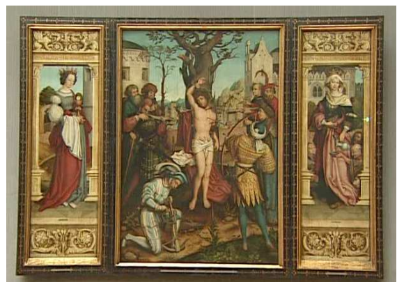
Das Original „Martyrium des hl. Sebastian“ von Hans Holbein d. Ä. in der Münchner Pinakothek

L2: 1 Kor 3,16-23 Ev: Mt 5,38-48 L2: 1 Kor 4,1-5 Ev: Mt 6,24-34