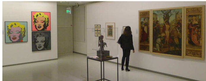
In der Nachbarschaft von Andy Warhol's Marilyn Monroe: die Kopie des Sebastiansaltars aus der Michaelkirche in der Ludwigsgalerie