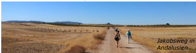
Jakobsweg in Andalusien