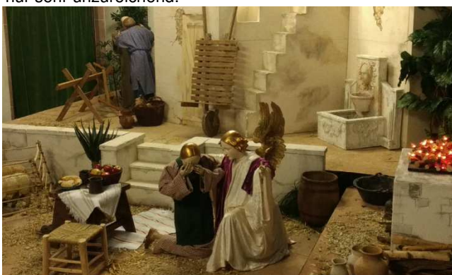
Krippe in der Marienkirche: Verkündigung Mariens