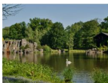
Biotopwildpark Anholter Schweiz, Isselburg

16. Juli 2017, Abfahrt um 09:15 Uhr ab Kirche St. Johannes Evangelist Rückfahrt um 18:00 Uhr Fahrpreis: 17,- Euro