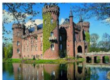
Schloss Moyland, Bedburg-Hau