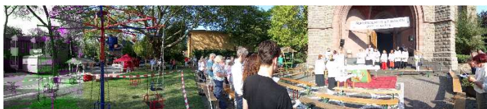
Das Gemeindefest begann mit der „open-air“ Messe vor der Marienkirche, danach folgte das bunte Treiben auf der abgesperrten Elsa-Brändström-Straße

► Das 51. Gemeindefest St. Marien „rund um die Türme“ ist bereits Geschichte. Es war ein gelungenes und entspanntes Fest. Viele Menschen ließen sich begeistern. Das Wetter bot am Wochenende die ganze Bandbreite von Hitze bis Abkühlung, von stahlblauem Himmel bis dunklen Regenschauern. Das alles war sogar erträglich. Ein herzliches Dankeschön allen Organisatoren, Helfern und Mitarbeitern „vor und hinter den Kulissen“ bzw. Altar, Biertresen, Reibekuchenpfanne, Pommestheke, Kuchenbuffet, Spieletischen und und und ...!