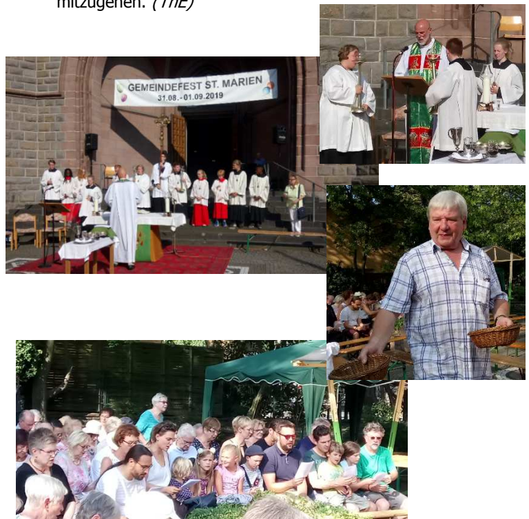
Eindrücke von der hl. Messe beim letzten Gemeindefest in St. Marien.

Es wird jetzt immer dringender, das Pfarreibewusstsein zu stärken. Wir gehören als Christen in der Pfarrei zusammen, müssen uns gegenseitig stärken, zusammenrücken und bisherige Gemeindegrenzen überwinden. In der gemeinsamen sonntäglichen Eucharistiefeier mit vielen Gläubigen zusammen erfahren wir auf Dauer mehr Stärkung, Ermutigung und Zusammenhalt. Der große Stadtgottesdienst Ende August mit vielen Christen zusammen war wieder eine gute beispielhafte Erfahrung. Die Entfernungen zwischen den Kirchorten bei uns in Alt-Oberhausen sind relativ gering. Es werden bei Ihnen, den Gläubigen, Umorientierungen notwendig. Das Beharren auf dem bisherigen „eigenen“ Kirchort wird keinen Bestand haben können. Ich bitte Sie, diese Veränderungen mitzutragen und neue Wege mitzugehen. (ThE)